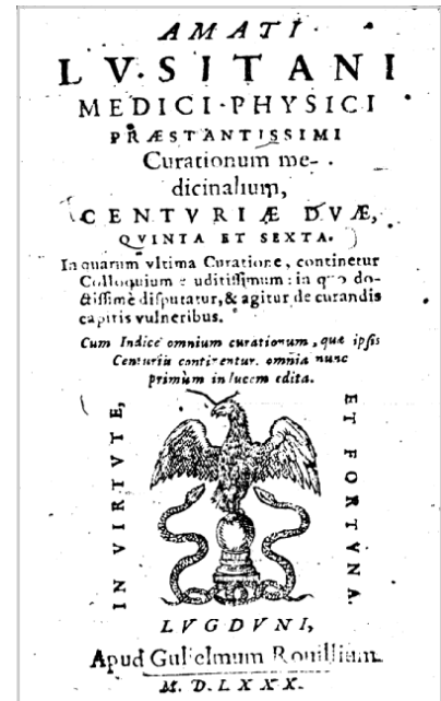
Fig. 1 Amatus Lusitanus .