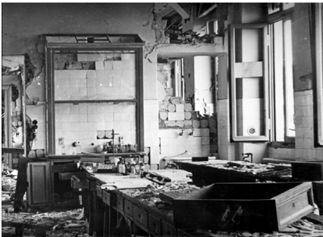
Figura 4 L'Ospedale delle Molinette dopo uno dei bombardamenti durante il secondo conflitto mondiale (1943).

ta "Amici di Brugg" (fig. 3). Per alcuni decenni costituirà il riferimento per chi in Italia vuole esercitare dignitosamente la professione. Gli Amici di Brugg assumono con il tempo le caratteristiche di una vera e propria università privata con i propri libri, una rivista intitolata "Odontoiatria Pratica" e l'organizzazione di congressi che da allora continuano ininterrottamente assumendo carattere nazionale e che attualmente si svolgono a Rimini. L'Università ufficiale, pur istituendo la specializzazione in odontoiatria, non la rende obbligatoria. Lo scenario cambia radicalmente con l'introduzione del Corso di Laurea in Odontoiatria: viene messo a punto un modello originale di insegnamento in protesi che in seguito sarà esteso