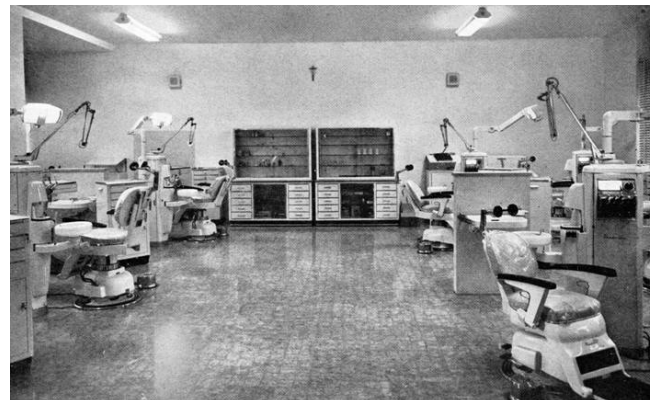
Figura 5 Il reparto di Protesi della Nuova Clinica Odontostomatologica Inaugurata nel 1963 all'interno dell'Ospedale delle Molinette.