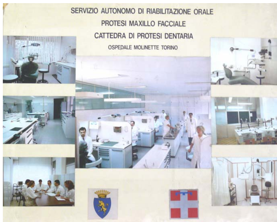
Figura 6 La riorganizzazione del reparto di protesi con nuove attrezzature. 1990

radicalement avec l'introduction du diplôme en odontologie : il est développé un modèle original de l'enseignement en prothèse dentaire qui sera par la suite étendu à d'autres disciplines. De la vieille clinique dentaire voulue par le Professeur Dino Rocca à l'hôpital les « Molinette », l'école a récemment emménagé dans un bâtiment moderne, situé dans le Lingotto, l'historique usine FIAT, la Dental School.