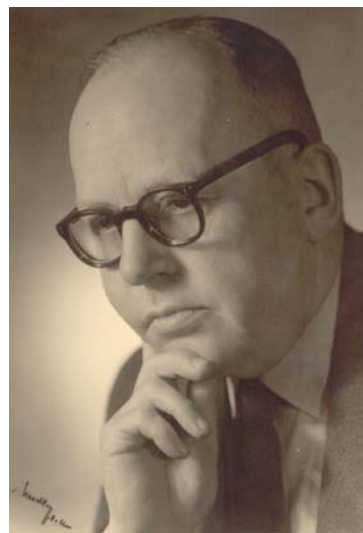
Fig. 5. Le professeur Reichenbach en 1957.

Reichenbach fut l'un des stomatologues les plus importants de l'Allemagne de l'Est (6). Il fut le co-auteur d'un ouvrage clinique sur la chirurgie dentaire, Lehrbuch der klinischen Zahn-, Mund- und Kieferheilkunde , Leipzig, 1941, qui connut une deuxième édition en 1952. À partir de 1950, il devint membre de l'Académie allemande Léopoldina, dont il assura la vice-présidence de 1955 à 1973. La défaite de la Seconde Guerre mondiale eut comme conséquence symbolique la construction du mur de Berlin (1961). Reichenbach eut toujours une attitude critique à l'égard de la politique de santé du régime de la Sozialistische Einheitspartei Deutschland (SED). En tant que vice-président de la Léopoldina, il tenta de conserver l'unité du monde scientifique allemand. En 1962, comme ses idées étaient plutôt gênantes sur le plan politique, il fut déclaré d'office professeur émérite (7). Comme prétexte, on organisa un congrès, au cours duquel Reichenbach invita de nombreux chirurgiens-dentistes de l'Allemagne de l'Ouest. Son contrat de transfert à l'Ouest fut annulé par le Ministère de l'Intérieur de l'Allemagne de l'Est. En 1965, Reichenbach fut reconduit dans ses fonctions de chirurgien-dentiste en chef à Halle, de telle sorte qu'il put poursuivre ses travaux scientifiques. (Fig. 5) Reichenbach s'est beaucoup intéressé à la musique; il fut un