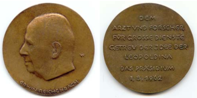
Fig. 1. Avers de la médaille, dédiée à Reichenbach (exemplaire Reichenbach, collection Heckert).