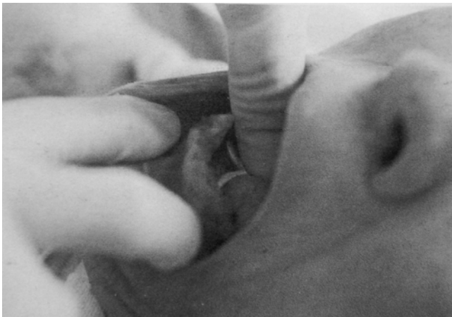
Fig. 6. Positionnement de la partie bifide de l'instrument au niveau de la face interne de la mandibule © Fr. Janot.

leurs dimensions et leurs parties actives sont adaptées à l'anatomie du lieu et au geste. Le placement doit se faire d'une manière simple, respectant la liberté de la main travaillante, dans un mouvement rapide et sûr. L'embrochage de la partie pointue dans le trou palatin antérieur étant impossible, la tête du cadavre est placée en hyper extension. Ainsi on augmente la distance palais dur - mandibule. La partie pointue est à bonne distance du palais mou. Il ne reste plus qu'à la faire pénétrer au niveau de la limite palais dur - palais mou. En maintenant la mandibule largement ouverte, il est facile de positionner ensuite la partie bifide de la réplique au niveau des apophyses geni . Les deux branches, qui s'adaptent parfaitement à l'os, se verrouillent et restent stables (Fig. 6). Ainsi disposé, l'instrument, qui permet le maintien d'une ouverture buccale satisfaisante, autorise alors un accès facile à tous les organes intra-buccaux. De plus, la pointe de la langue se trouve rejetée en bas et en arrière. Elle se positionne en pont, mettant en évidence sa face supérieure. À l'époque gréco-romaine, les embaumeurs apposent alors une fine feuille d'or. Sa couleur solaire et la puissance de sa lumière permettent d'éloigner les éléments pathogènes susceptibles de détruire cet organe. Le caractère divin du métal se transmet à la chair et confère ainsi l'éternité.