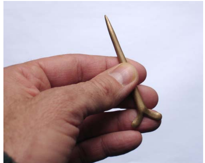
Fig. 4 , 5. Tenues en main de la réplique de l'instrument- peseshkaf © Fr. Janot.

la pyramide du roi Pépy II, il date de l'Ancien Empire. Malheureusement, il n'existe pas, pour le moment, d'autres exemplaires identifiés. En revanche, le Bucheum a livré un instrument de forme identique, mais aux dimensions adaptées à la taille de l'animal (21).