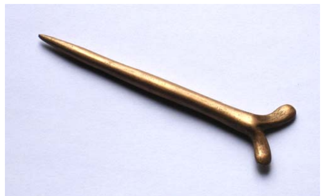
Fig. 3. Réplique de l'instrument- peseshak © Fr. Janot.