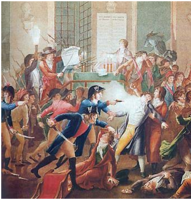
Fig. 4. L'arrestation de Robespierre, telle qu'on l'a longtemps enseignée dans les écoles de la République. Tableau anonyme, musée Carnavalet (Paris).