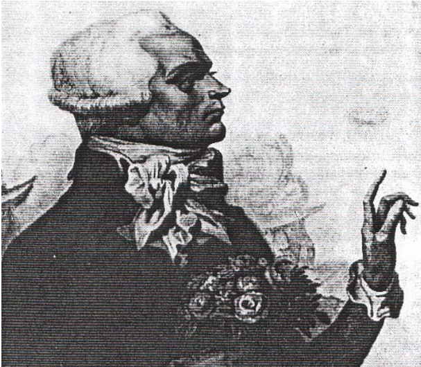
Fig. 1. Une bouche "contrariée", mâchoires crispées et lèvres serrées, telle que décrite par les témoins, à la fête de l'Être Suprême. Histoire des Girondins – Alphonse de Lamartine 1868).