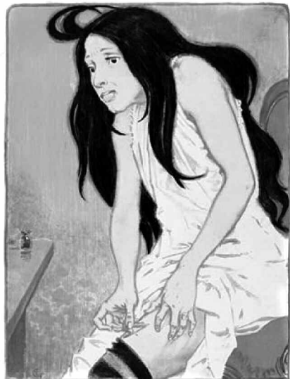
Fig. 3 : Eugène Grasset, La morphinomanie , chromolithographie, 1897.

Un phénomène identique fut observé aux États-Unis. Une première vague de toxicomanie à la morphine voyait le jour vers 1860, principalement dans la population féminine, dite "middle-class", conséquence d'une prescription immodérée de morphine par bon nombre de médecins, pour des affections extrêmement diverses, grâce à des préparations vendues