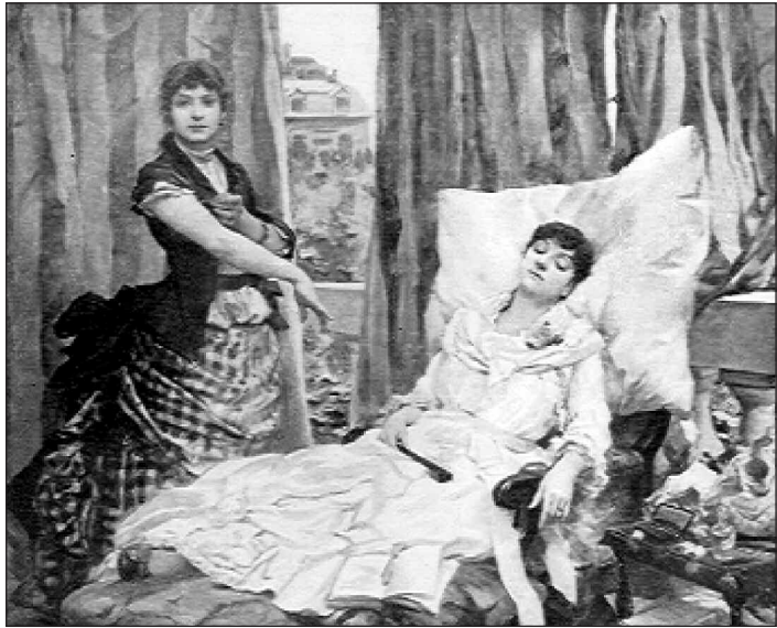
Fig. 2 : La morphine , par Georges Moreau de Tours, 1886.

l'alcool, diffusant dans un contexte économique favorable. Dans les années 1880, l'usage récréatif de la morphine était à son apogée. En dehors du monde médical et paramédical qui constitua longtemps le milieu le plus touché par la morphinomanie, c'est dans les cercles bourgeois et littéraires que la "fée grise" comptait ses adeptes : femmes du monde, hommes politiques et intellectuels. La "morphinée" était une